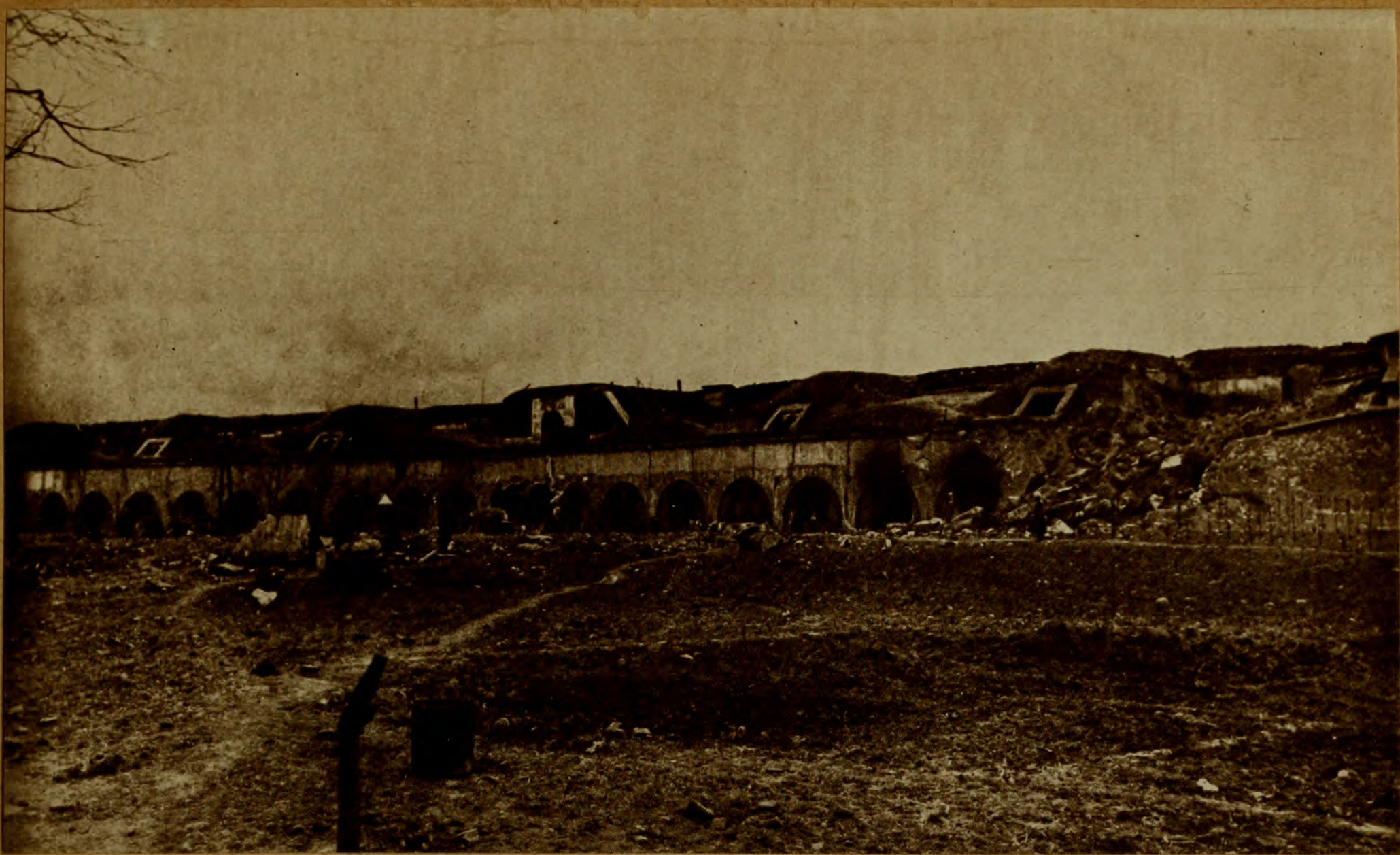
Взорванные форты въ Перемышлѣ.